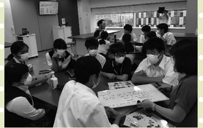
プレゼンテーション