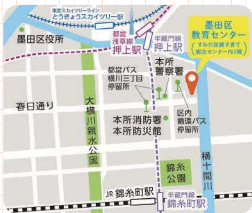
所在地 墨田区横川5-7-4