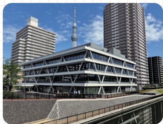
全体図 すみだ保健子育て総合センター