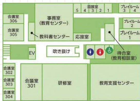
3階 教育センターフロアマップ