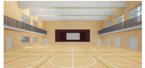
建設中の二葉小学校体育館棟(イメージ図)