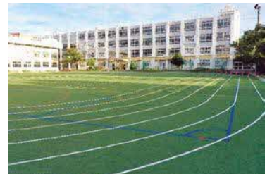
区内初の人工芝校庭(寺島中学校、令和7年9月完成)