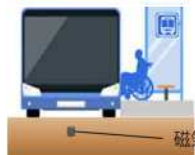
【自動運行補助施設のイメージ】

磁気マーカー 磁気マーカーによるバス停等における 正着制御のためのインフラからの支援