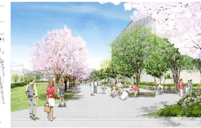
図2 キャンパスコモンの整備イメージ

この整備計画図及び内容については、あと・まち協議会出席者の賛同を得たが、テニスコートに関しては、「この場所にテニスコートは必要なのか」、「移転して公園にしてほしい」、「テニスコート南側の道路が狭くて危ない」等の意見が複数出された。