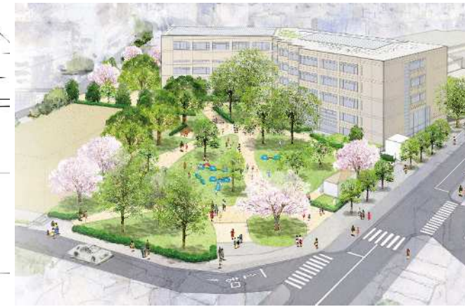
図1 あずま百樹園の整備イメージ