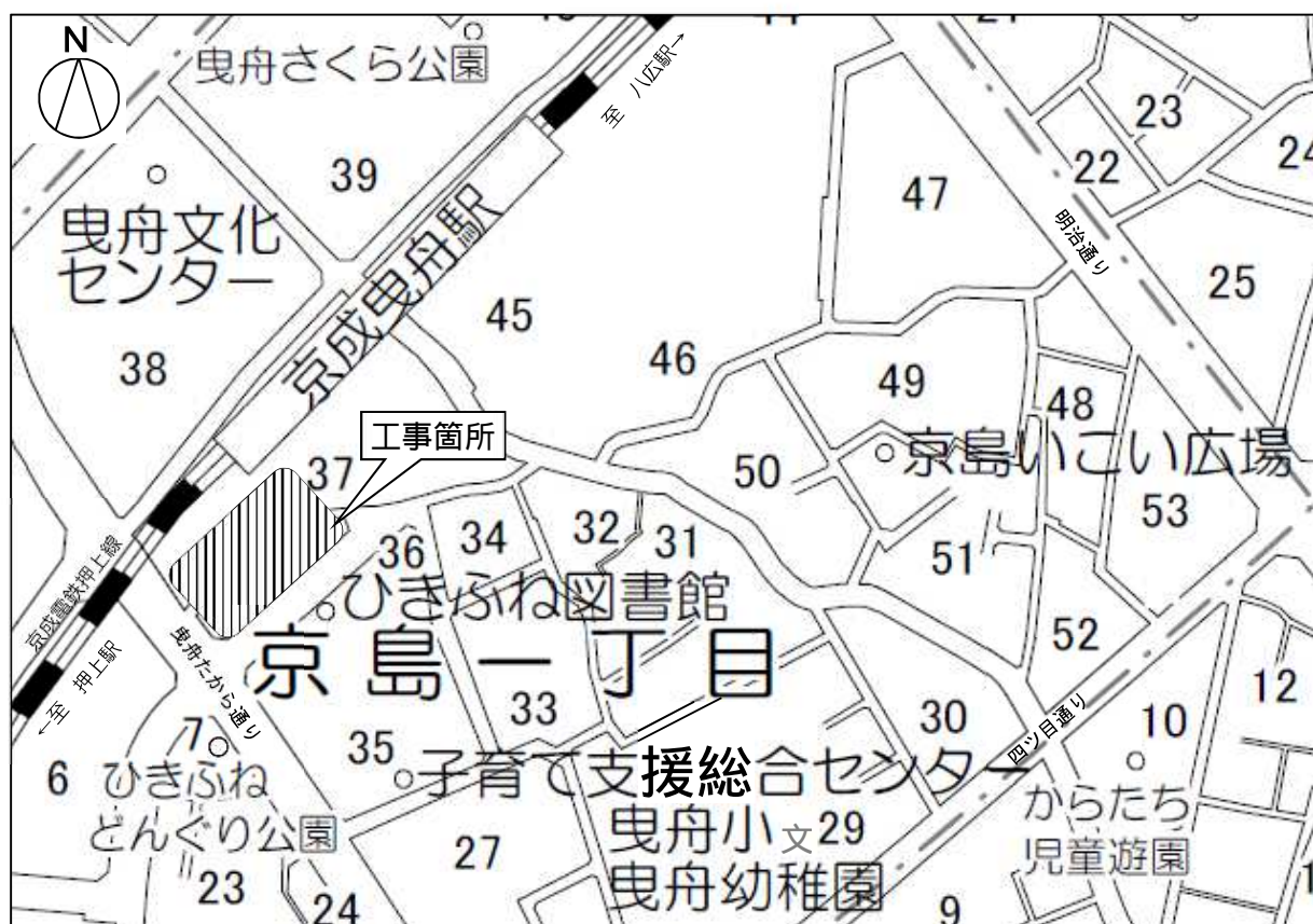
案 内 図