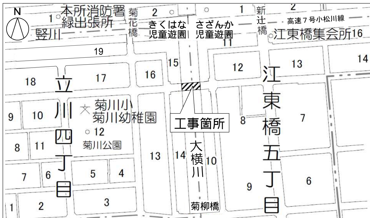
案 内 図