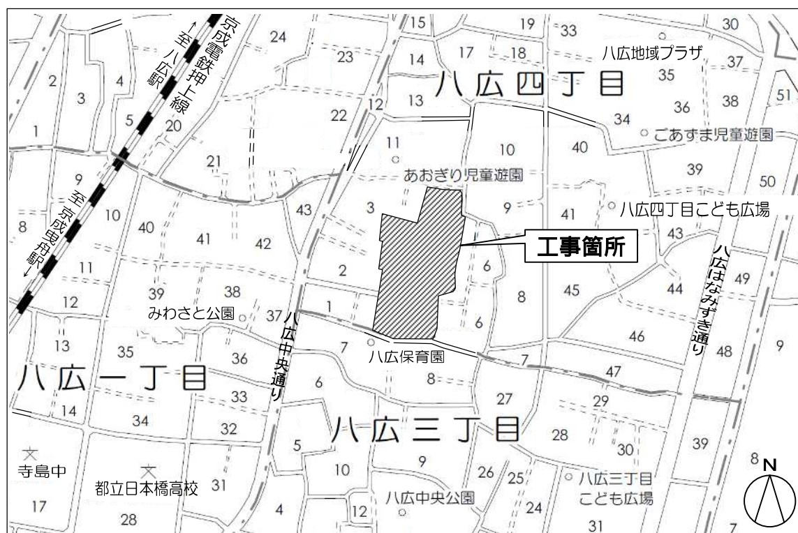
案 内 図