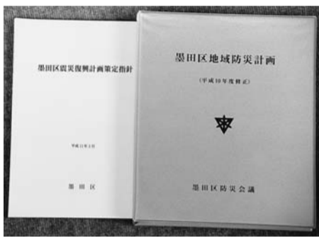
震災復興計画策定指針と地域防災計画

墨田区震災復興計画策定指針の概要について報告がありました。この指針は、阪神・淡路大震災の復興対策の状況、東京都が策定した「東京都都市復興マニュアル」等を踏まえ、震災後において速やかな復興対策の推進を可能にすることを目的に策定されたもので、「平常時における役割」と「震災後における役割」を定めています。また、墨田区地域防災計画の10年度修正内容、震災対策用小規模応急給水施設の概要、10年度地域防災活動拠点会議活動記録についても、報告がありました。