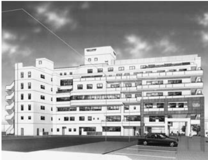
白鬚橋老人保健施設(仮称)のイメージ図