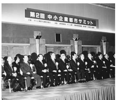
昨年大田区で開催された中小企業サミット