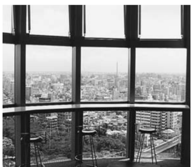
区役所内のリフレッシュコーナー

議案 職員の勤務時間、休日・休暇等に関する条例の一部を改正する条例・職員の休暇制度の体系的整備を図るため、夏季休暇、ポランテア休暇及びリフレッシュ休暇を新たに特別休暇に加えるほか、地方公務員法の一部改正に伴い、休憩時間の一斉付与の例外規定を設けるもの——原案どおり可決すべきものと異議なく決定した。 陳情 定住外国人に対する地方参政権に関する陳情/定住外国人の地方参政権に関する陳情——「定住外国人に地方参政権を付与すべきとする陳情と付与すべきでないとする陳情が同時に提出されている状況にある中で、現段階において、議会として一方の陳情のみを採択した場合、混乱が生じるのではないかと」、「定住外国人の地方参政権の問題について、国民の議論がもっと高まっていくべき」などの意見が出され、閉会中も継続審査するものとした。 議案 墨田区特別区税条例の一部を改正する条例・地方税法の一部改正に伴い、長期譲渡所得に係る区民税の課税の特例に関する税率を改定するとともに、特定扶養親族に係る扶養控除額を引き上げるとともに——原案どおり可決すべきものと異議なく決定した。 請願 国民年金等の年金制度改善に関する請願——「現在の年金の財政状況からみて、財源の確保が難しい」などの意見が出され、不採択とするものと決定した。 報告 第3回中小企業サミット(すみだサミット)の開催について——中小企業都市連絡協議会総会で決定された開催概要について報告があった。 報告 東京都市計画高度地区(墨田区決定)の変更について——建築基準法の改正による「連担建築物設計制度」創設に伴い、第三種高度地区に係る高さ制限の特例を変更する旨の報告があった。