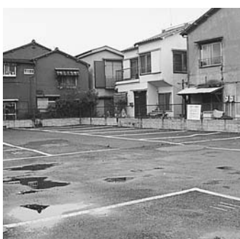
コミュニティ住宅建設予定地