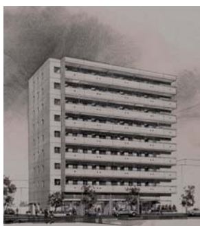
シティハイム亀沢のイメージ図

報告 区立保育園における「保育相談事業」の実施について——子育て支援事業の充実を図るため、区立保育園2園(江東橋保育園及び長浦保育園)において「子育て相談事業」を実施する旨の報告があった。