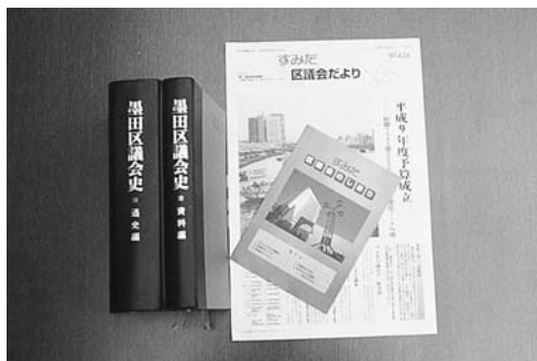
墨田区議会発行の広報物

区議会議長、監査委員、総務委員長、決算特別委員長などを歴任。区政功労者(特別)表彰、永年在職25年表彰などを受章。