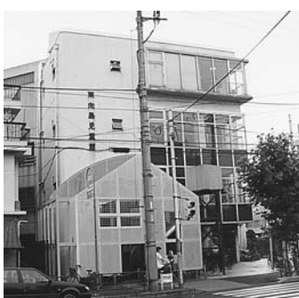
耐震補強工事が行われる東向島児童館

報告 コミュニティ住宅の建設計画概要について—向島橋銀座通商店街に面する京島三丁目52番に建設予定のコミュニティ住宅の基本設計について報告があった。