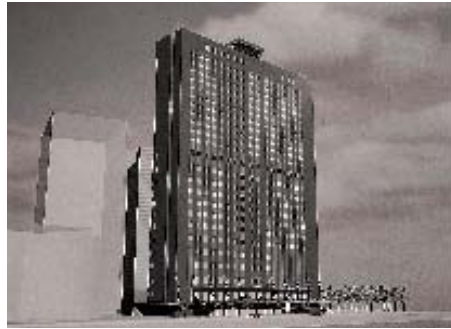
国際ファッションセンターのイメージ図

これまでのところ、会社と区との間で法律上の債権や債務は発生しておらず、債務負担行為の議決は必要とはされていない。したがって、権限の逸脱はない。