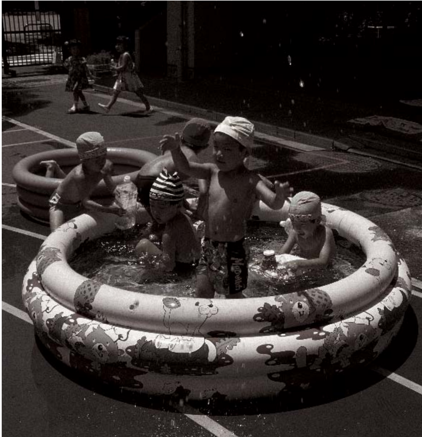
「水遊び」— 緑幼稚園にて — ※1面に掲載する写真を募集しています(詳細4面)。