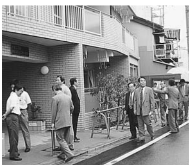
京島二丁目第5コミュニティ住宅