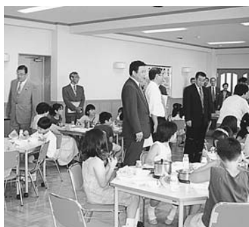
外手小学校(ランチルーム)

【報告】 区立学校適正配置の進捗状況について——昨年11月の実施計画素案の公表後、地元説明会や地元協議会を通じて地域との話し合いを続けているので、その報告があった。 7月8日 【視察】 外手小学校(ランチルーム)などを視察した。