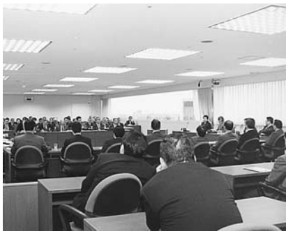
昨年の決算特別委員会のもよう

区議会では、決算報告を受けて、平成8年度予算が適正かつ効果的に執行されているかどうかを審査するため、18名の議員で構成する決算特別委員会を設置し、10月24日から具体的な審査を継続して行っています。決算審査のようは、次号でお知らせする予定です。