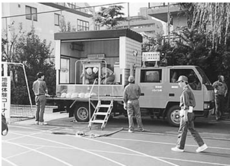
起震車による地震体験

東京都は平成10年4月をめぐりに「避難場所」計画の改定を行う予定で各区に改定案を明示している。この機会に、各避難場所別の町会・自治会合同による避難訓練を行うことはどうか。