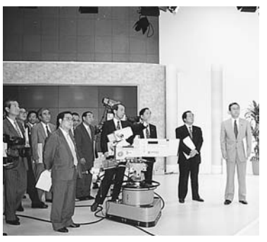
東京メトロポリタンテレビジョン(株)