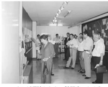
すみだ環境ふれあい館視察のもよう