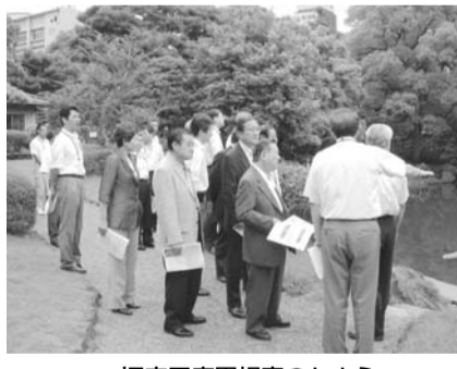
旧安田庭園視察のもよう

問 17年度の決算状況について、現時点で歳入は見通しと大きな乖離があるのか。決算剰余については、当初予算に計上した15億円を大幅に上回ると見込まれている。新タワー事業を中心としたグラウンドデザイン策定過程に臨む区長の基本的考え方は。