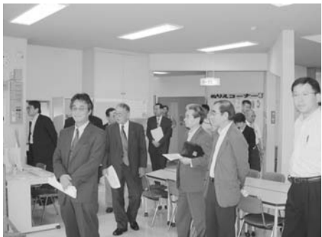
立花児童館視察のもよう