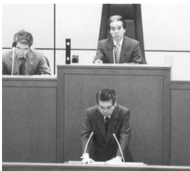
区長答弁(本会議場)