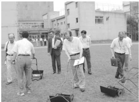
柳島小学校視察のもよう