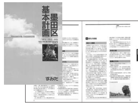
現在の墨田区基本計画