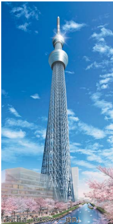
新タワー (イメージ図)

委員会の役割と所管事項 常任委員会 専門化、複雑化する地方公共団体の事務を、合理的かつ効率的に調査及び審査するために設置され、付託された議案や請願・陳情の審査等を行っています。 企画総務委員会 区政の総合的な計画、予算、組織、広報広聴や契約などに関する事項。他の委員会に属さない事項。 地域都市委員会 地域コミュニティ、文化振興、危機管理、リサイクル、清掃、環境保全、商工業振興、消費者対策、まちづくり、公園、道路や河川などに関する事項。 区民文教委員会 戸籍、国民健康保険、国民年金、税務、学校教育、スポーツ振興や生涯学習などに関する事項。 福祉保健委員会 子育て支援、高齢者・障害者福祉、介護保険、健康づくりや保健衛生などに関する事項。 新タワー建設・観光対策特別委員会 新タワー建設、区の新タワー周辺の環境整備、国際観光都市実現等に関する事項。 行財政改革等特別委員会 区が行財政改革及び地方分権推進に関する事項。 都市開発・災害対策特別委員会 災害並びに大規模開発事業及び鉄道立体化並びに地下鉄の建設促進及び区内交通体系の整備に関する事項。 ただし、「墨田区基本計画新タワー関連事業編」掲載事業を除く。 特別委員会 特定の事件の調査または審査を行う必要が生じた場合、議会の議決により設置され、付託された事件の調査または審査が終われば消滅します。 議会運営委員会 ①議会の運営に関する事項②議会の会議規則、委員会に関する条例等に関する事項③議長の諮問に関する事項のほか、議案や請願・陳情の審査を行うこともできます。