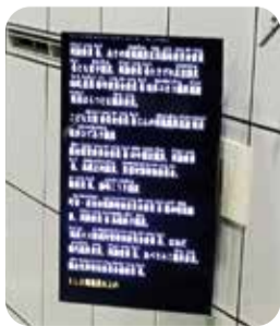
字幕表示のようす

墨田区議会では、傍聴席において、「手話通訳者の配置」(事前申込み制)と「磁気ループシステムの設置」を行っており、本会議場の傍聴席では、音声の字幕表示(文字通訳)も行っています。