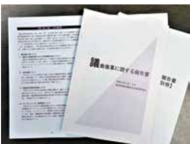
議会改革に関する報告書

調査・検討事項を、議会運営、議会改革、議会バリアフリー・デジタル化に関することに分類し、順次、調査等を行っていくこととした。