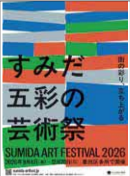
すみだ五彩の芸術祭 PRポスター

答 墨田区文化祭は、非常に長い歴史を持つイベントで、この芸術祭においても、共催企画ということの一つの大きな柱として開催する運びになっており、皆さんにも広くご参画いただくことになっている。文化祭は、多彩なジャンルがあり、芸術性に合わせて部門の増加を検討している。すみだまつり・こどもまつりについては、お互いが広く広報上の連携を図って、お客様をお呼びすることを考えている。