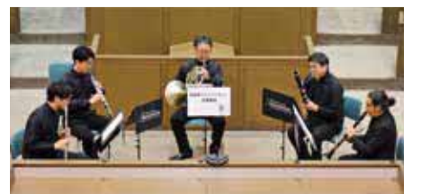
ミニコンサートの様子