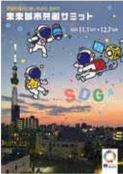
SDGs普及啓発事業 関連行事リーフレット

答 2030年は基本計画の中間改定のタイミングでもあり、今後はSDGsのその先を見据えた全庁的な議論が必要であると考えている。国連での議論も注視しながら、大学のありまちな議論も注視しながら、第3期の未来都市計画を検討していく。