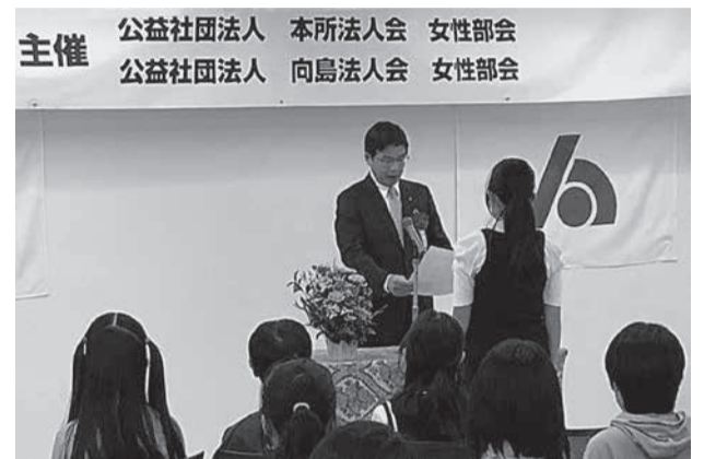
第15回 税に関する「絵はがきコンクール」表彰式

申告手続は、インターネットや郵送が便利です。ご不明な点は、最寄りの各税務関係機関へお気軽にお問い合わせください(4面「税についての問合せ先」を参照)。