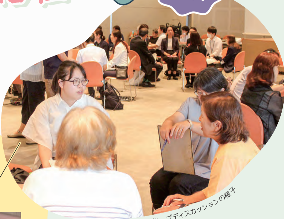
昨年度のグループディスカッションの様子

「地域福祉」とは、誰もが地域で安心して暮らせるよう、住民や様々な福祉関係者が協力して地域の福祉課題に取り組むことです。「すみだ地域福祉・ボランティアフォーラム」では、地域福祉に関心がある方などが情報を交換し、課題解決のヒントを得ています。あなたも参加してみませんか? [問合せ] 地域福祉課地域福祉担当 ☎5608-1163