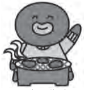
墨田区食品衛生キャラクター「すみだこ」

神経疾患を引き起こす可能性があります。子どもや高齢者など、抵抗力の弱い方が食べると非常に危険です。なお、牛レバーと豚肉(内臓を含む)は生食が禁止されています。飲食店ではよく加熱された肉料理を選び、自分で調理する場合も中心部まで十分に加熱して食べましょう。