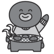
墨田区食品衛生キャラクター「すみだこ」

神経疾患を引き起こす可能性があります。子どもや高齢者など、抵抗力の弱い方が食べると非常に危険です。なお、牛レバーと豚肉(内臓を含む)は生食が禁止されています。飲食店ではよく加熱された肉料理を選び、自分で調理する場合も中心部まで十分に加熱して食べましょう。