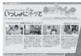
ホームページ「いっしょにネット」