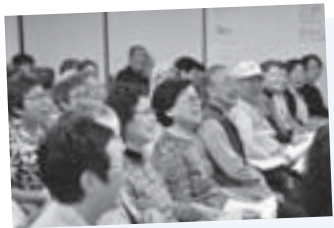
笑いあり、涙ありの、癒しの時間

外にも、最近ではあちこちのイベントに呼ばれるようになりました。昨年5月には、3つのバンド合同でコンサートをやったのですが、曳舟文化センターが満席になりました。活動の場が増えると、週1回の練習にも力が入りますよ。