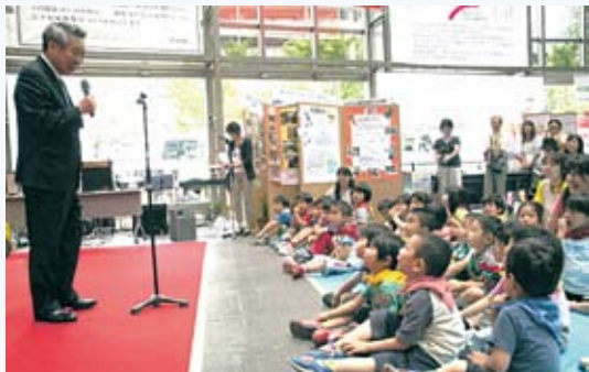
東駒形保育園の子どもたちに「食べ物大切にしてください」とお話ししました

先月、東武鉄道株式会社と東武タワースカイツリー株式会社から、ツリーの開業日や展望台の入場料金などが発表されました。開業への注目が高まる中、区では、このビジネスチャンスを逃さず、ツリーを起爆剤とした地域経済の活性化に力を入れていきます。中でも、「ものづくりのまちすみだ」の宝である、高い技術を持つ職人や企業が創り出す高品質な製品等を「すみだブランド」として世界へ発信していきます。また、区内には、まちのPRキャラクターとして「おしなりくん」、 ねえ 「あづちゃん」、 ねえ 「向嶋言問姐さん」が誕生しています。関連商品も人気があるようで、まち全体が活気づいてきたことを心強く思います。さて、区では、福島第一原子力発電所の事