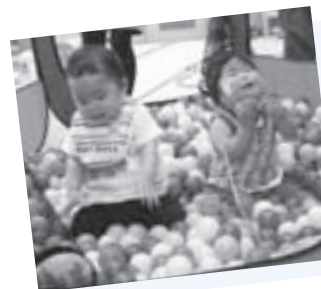
サロンには、ボールプールなどの大きなおもちゃもいっぱい！

多くの親子に出会うことができ、子どもたちの笑顔から元気をもらえる活動です。ボランティアをする側と受ける側が「一緒に楽しむ（場の共有と心の共感）」という姿勢で活動しています。現在、月2回だけの開催なので、たくさんのおもちゃがあまり使われずにもったいないのですが、ボランティアが増えれば、開催日や会場が増えるかもしれません。興味を持ったら、ためらわずに、ぜひ、一緒にやってみてほしいですね。