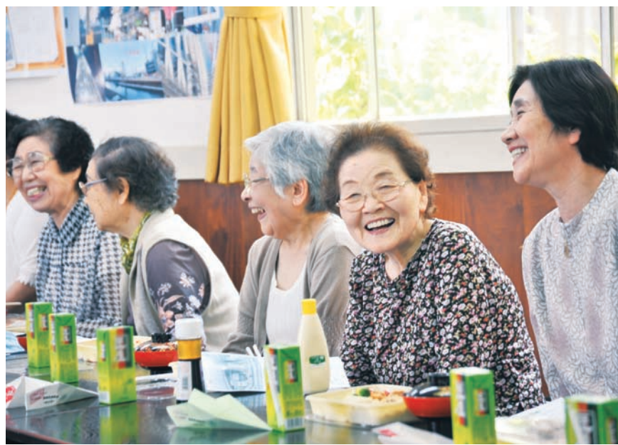
笑顔の輪が広がります(小梅一丁目町会会館で行われている「ひまわりサロン」にて)

【問合せ】▶厚生課厚生担当 公5608-6150 ▶すみだボランティアセンター 公3612-2940