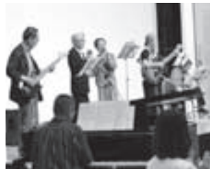
先月開かれた「食育フェスティバル」でのメンバーの勇姿