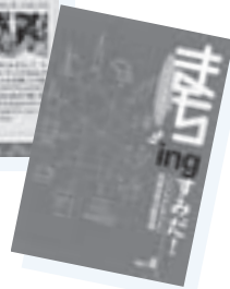
小冊子「まちingすみだ！（マッチングすみだ）」