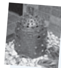
陶器の「つり鐘」に明かりを入れて、まちを照らします