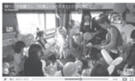
メンバーによる作品の一つが、日本財団主催の「日本ドキュメンタリー動画祭2010」で優秀賞を受賞！

【問合せ】墨田フィルムコミッション設立準備室（墨田区観光協会内） ☎5608-6951