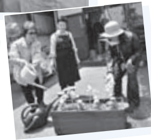
「店先が明るくなっていいわね」と、プランターの設置に協力してくれたお店の方も大喜び