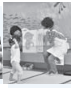
ボランティアさんによる大きな絵本の読み聞かせに引き込まれます