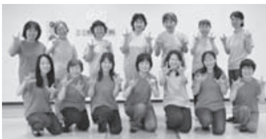
「アイ・ラブ・ユー」という手話で、ハイポーズ！

健聴者（聴覚に障害がない人）と聴覚障害者が一緒に仲良く活動していることが、このサークルの良いところですね。練習後のティータイムでも話が尽きず、時間を忘れるほど楽しいときを過ごしていますよ。