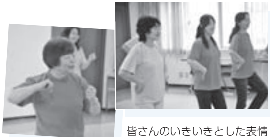
皆さんのいきいきとした表情に思わず見とれてしまいます