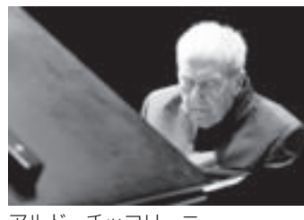
アルド・チッコリーニ