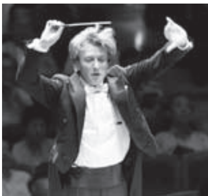
クリスティアン・アルミンク

シーズン幕開けの指揮者は、平成15年に新日本フィルハーモニー交響楽団の音楽監督に就任したクリスティアン・アルミンクです。彼は、新日本フィルと切磋琢磨し続けるとともに、音楽監督として演目や指揮者・