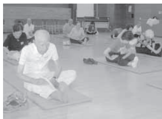
手軽な運動で、いつまでも元気に！(運動・栄養教室から)

います。なお、受講前に、9月2日開催の「栄養講演会」への参加が必要です。 【つき・ふん】左表のとおり【対象】区内在住の65歳以上で、医師から運動を制限されていない方【定員】各会場先着30人【費用】各会場500円(テキスト代)178へ