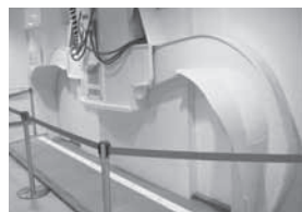
工場内に展示されている「ごみクレーン」の実物大模型

墨田清掃工場(東墨田1-10)の職員が、設備等の説明を交えながら工場内をご案内します。皆さんの出すごみ、どのように処理・焼却されているのか、見学してみませんか。 【日時】8月20日(土)午前9時半～午後3時 *受付は午後2時半まで【費用】無料【申込み】当日直接会場へ *小学生以下は保護者の同伴が必要 *車での来場は不可【問合せ】墨田清掃工場 ☎3613-5311