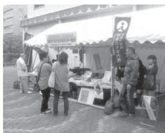
今年のゴールデンウィークは大勢の方にご利用いただきました

3「大横川親水公園内(吾妻橋3-4・業平橋北側)【問合せ】観光課観光担当(公5608-500)