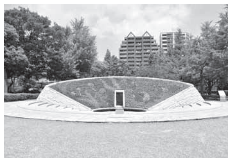
名簿が納められている「東京空襲犠牲者を追悼し平和を祈念する碑」

【申出先】都生活文化局文化振興部文化事業課(公5388-3141) ▼東京都慰霊協会(公623-1200)【問合せ】企画・