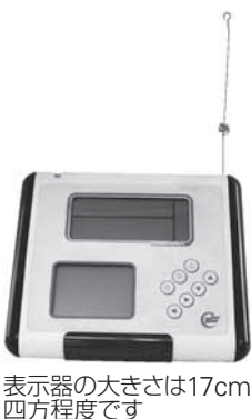
表示器の大きさは17cm四方程度です

【貸し出し期間】9月～11月の3か月間【対象】区内のご家庭 【申し込み】9月11日(日)午前9時から住所・氏名・電話番号を電話またはEメールで環境保全課環境管理担当 ☎5608-6207・☒KANKYOU@city.sumida.lg.jpへ