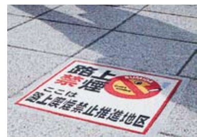
路面ステッカー等で、喫煙者のモラルに訴えかけます