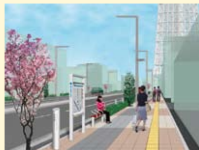
言問通り 整備イメージ図