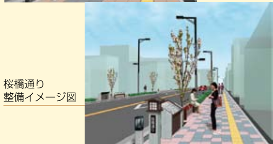
桜橋通り 整備イメージ図