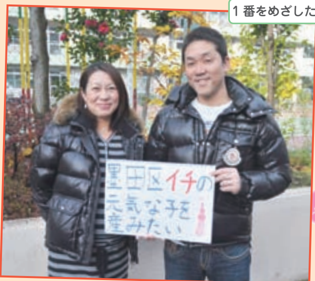
1 番をめざしたいこと