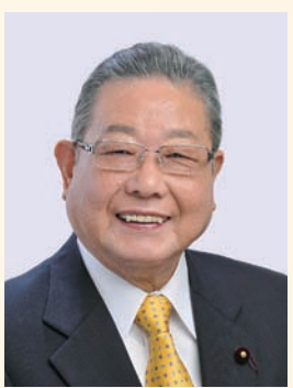
墨田区議会議長 瀧澤良仁