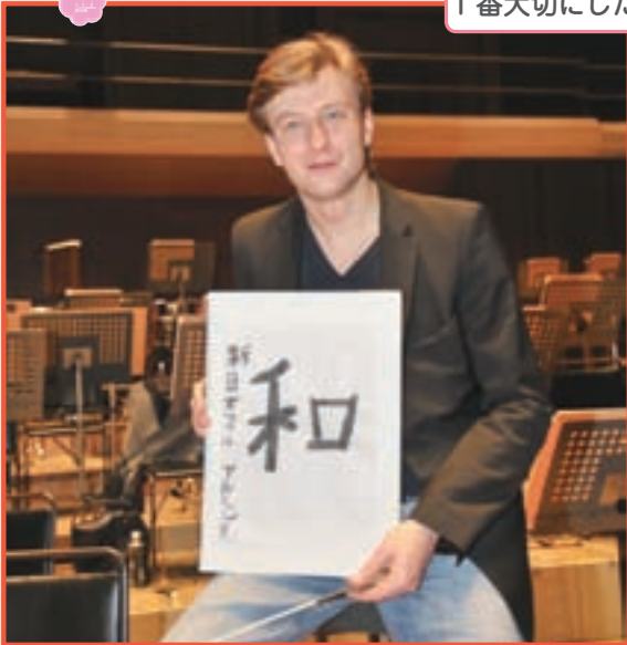
わがまちのオーケストラ「新日本フィルハーモニー交響楽団」の音楽監督を務める、指揮者のクリスティアン・アルミンクさん