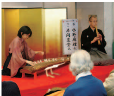
新春を彩る曲目を、箏・尺八の演奏でお楽しみいただけます

中学生以下と、身体障害者手帳・愛の手帳(都が交付する療育手帳)をお持ちの方に加え、今年3日から、療育手帳(都以外の自治体が交付するもの)・精神障害者保健福祉手帳をお持ちの方も入館料を無料とします。