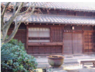
細い木割りの格子戸や獅子窓、黒漆喰壁など、江戸時代の農家と町家の雰囲気を今に伝えています

後1時~4時半11000円 ▼午後5時半~9時11000円【申込み】事前に電話で問合せ先へ (3619-7034)