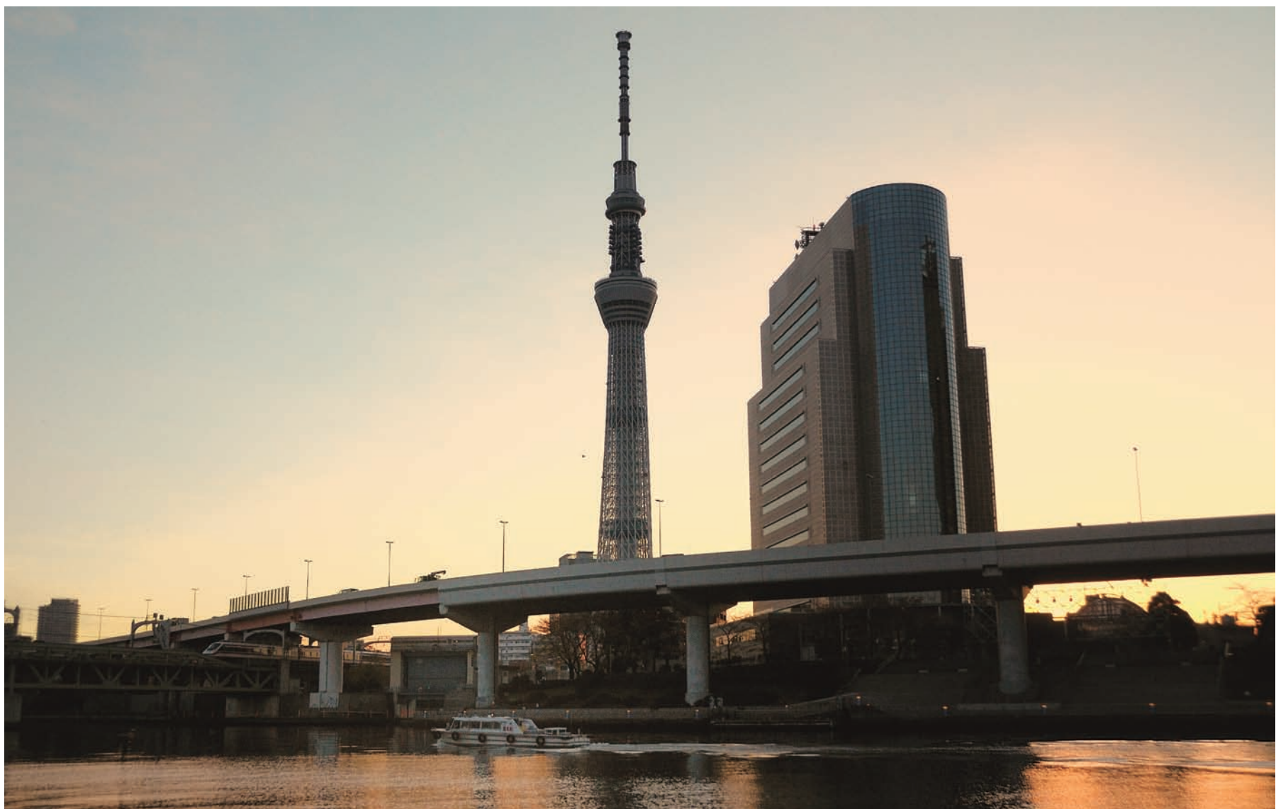
「2012年始動、朝の光とともに」