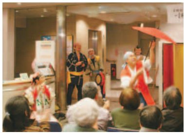
「春駒」では、幸せを呼び込む賑やかな歌や踊りで、一年の繁栄を祈念します