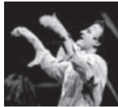
ジャン＝クリストフ・スピノジ

音楽だからこそ伝えられる祈りを皆さんとともにささげます。ぜひ、このコンサートに、お越しください。