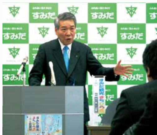
東京スカイツリーの開業効果を最大限区政に活かす「平成24年度予算案」を発表しました

東日本大震災から1年が経とうとしていますが、現在もなお、厳しい避難生活を余儀なくされている方々に、心からお見舞いを申し上げます。区では、震災で大きな被害を受けた岩手県釜石市の防災課長と両石町町内会長をお招きし、「被災地からの声 今、伝えたいこと「東日本大震災を忘れない」と題する講演会を今月6日に開催します。また、11日には外国人の方も含めた地域連携訓練もを行い、地域の防災力の向上に今後も努めていきたいと考えています。