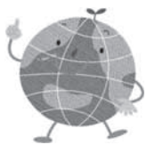
墨田区環境キャラクター「地球くん」