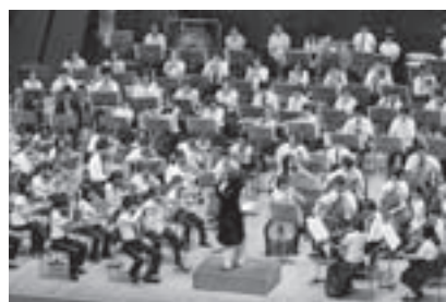
トリフォニーホール・ジュニア・オーケストラ