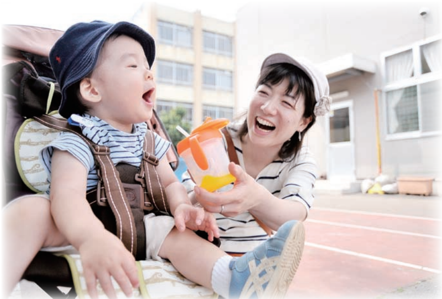
帽子の着用や水分補給に加え、保冷シートも敷いて熱中症を予防しています