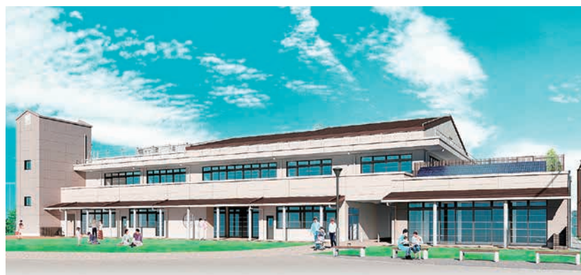
下町の雰囲気になじむよう、“和”を意識した外観デザインの本館(イメージ図)

今年4月、区内初の地域プラザである「八広地域プラザ“吾孺の里”」が、旧第五吾孺小学校の跡地に開館します。誰もが楽しめる居場所をめざして、地域の皆さんが中心となり、区と協働で施設の計画から運営方針に至るまで検討してきました。様々な世代間の交流や仲間作りなど、地域コミュニティの輪を広げる拠点となるこの地域プラザを、ぜひ、ご活用ください。