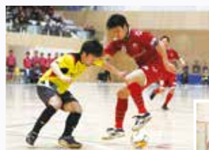
◀ 華やかな技術で、観る人を魅了します

今、「フウガすみだ」は、さらなる高みである日本フットサルリーグ、通称「Fリーグ」への昇格をめざし活動しています。近い将来、「すみだの誇り」としてその名を全国に、そして世界に轟かせるであろう「フウガすみだ」の活躍を、みんなで応援していきましょう。