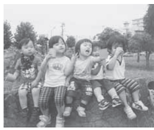
お散歩へ行くときには水分補給をします

【保育時間】 月曜日～金曜日の午前8時半～午後5時 *祝日・年末年始を除く *時間外保育(午前7時半～8時半、午後5時～6時)あり 【保育場所】 グループ型小規模保育室「ぶどうの木」(東駒形4-4-8 エステート寺内1階) 【対象】 区内在住で、生後10か月～2歳(25年4月1日現在)の健康な子ども 【募集数】 5人程度(選考)