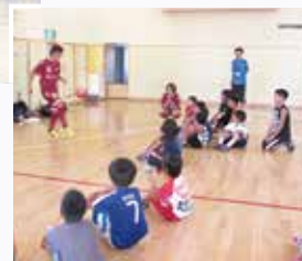
▶ フットサル教室の開催など、地域に根づいた活動を続けています