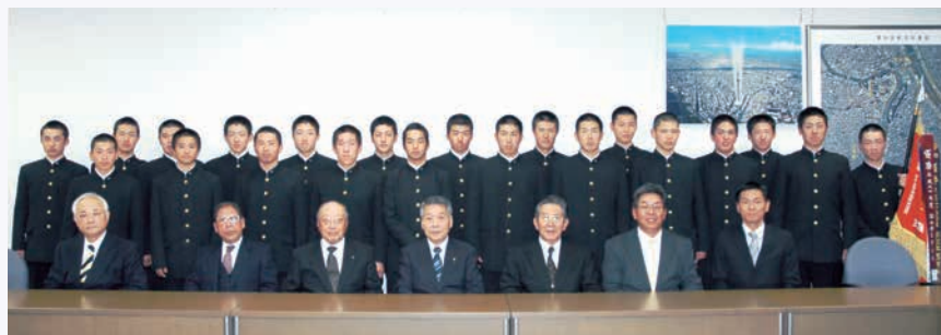
昨年12月、都大会優勝報告に来てくれた、安田学園高等学校野球部の皆さんと

また、この野球大会には「東北絆枠」という特別枠があり震災復興を支援しています。未曾有の被害をもたらした東日本大震災の教訓を風化させることなく、区では防災対策を区政の最重要課題として捉え、安全なまちづくりに取り組んでいきます。皆さんも日ごろから、災害への備えをお願いします。