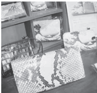
工房ショップ「紗蔵」の商品