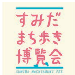
「すみだまち歩き博覧会」統一ロゴマーク