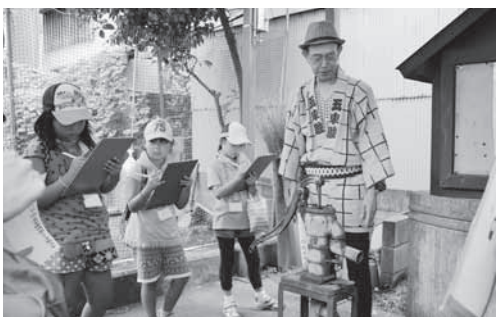
「すみだ まち探検ツアー」の訪問先の1つ「向島有季園」で、その名前の由来や環境について学びました

【とき】12月1日(日) 午後1時~2時【入場料】無料【申込み】直接会場へ【問合せ】区民活動推進課 ☎5608-3661