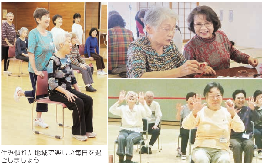
住み慣れた地域で楽しい毎日をごしましよ