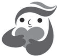
犯罪被害者等支援のシンボルマーク「ギョウとちゃん」