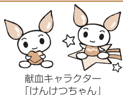
献血キャラクター「けんけつちゃん」

☎ = 電話 FAX = ファクス ☎ = Eメール 📧 = ホームページアドレス