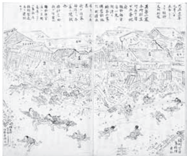
「国立歴史民俗博物館」提供の「大正震災本所方面見聞誌」(鈴木富美氏所蔵)

と、身体障害者手帳・愛の手帳・療育手帳・精神障害者保健福祉手帳をお持ちの方は無料 【申込み】 期間中、直接会場へ 【問合せ】 すみだ郷土文化資料館 ☎5619-7034 *毎週月曜日・毎月第4火曜日(祝日のときは翌日)、12月29日~26年1月2日は休館