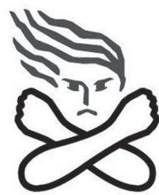
女性に対する暴力根絶の ためのシンボルマーク

パープルリボンプロジェクト は、女性への暴力を根絶するた めの国際的な運動です。すみだ 女性センターでは、この運動を 周知する活動の一環として、パ ネル展を開催します。 開催期間中は、パープルリボ