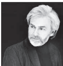
クリスチャン・ツィメルマン