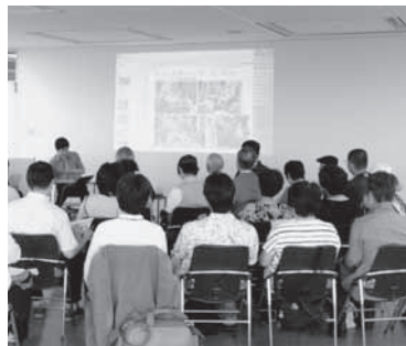
「すみだのまちづくり応援ムービー」を観て、みんなで語り合おう