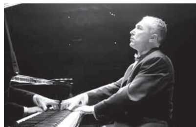
セルゲイ・シェブキン