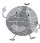
墨田区環境キャラクター「地球くん」