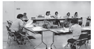
会議で意見を交わす委員の皆さん

※その他、乳幼児ワーキンググループを8回、学齢ワーキンググループを5回開催しました。