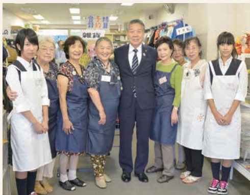
すみだリサイクル活動センター「たんぼぼ」などを活用して、資源を有効に活用しましょう

過日、13歳の少年が振り込め詐欺の受取役として関わり補導されたというニュースがありました。振り込め詐欺についての注意喚起は毎日のようになされているにも関わらず、今年6月までの区内での振り込め詐欺等の件数・被害額は、23件・約6700万円にのぼっています。高齢者だけでなく幅広い年代に被害が及んでいますので、「自分は大丈夫」と過信せず、とっさの時の対策を立てておきましょう。