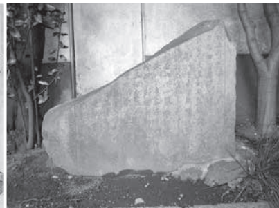
【左】国貞「初代豊国死絵」(早稲田大学演劇博物館蔵) 【上】歌川豊国の筆塚