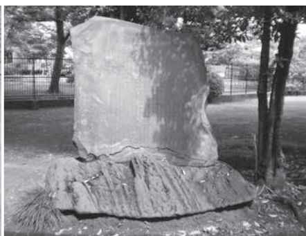
【左】芳富「山海愛度図会 国芳肖像」(東京国立博物館蔵) 【上】歌川国芳の碑