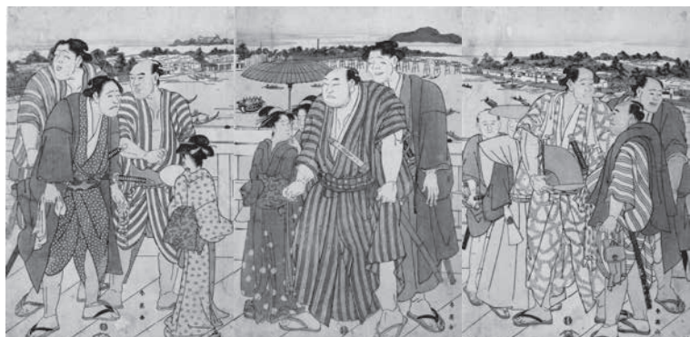
勝川春英「両国橋通行之図」(相撲博物館蔵)