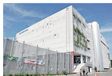
区総合体育館(錦糸4-15-1)