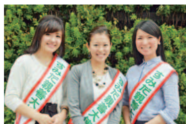
第15代すみだ親善大使