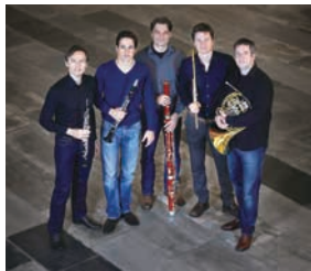
アンサンブル・ウィーン=ベルリン