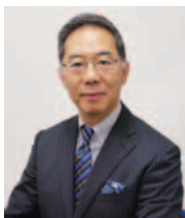
町永福カキ 永福カキ NHK 講師(元) 永福カキ 会 永福カキ 演 永福カキ 演 永福カキ 社 永福カキ 社 永福カキ