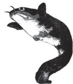
葛飾北斎「三体画譜」より「鯰」

今後も「すみだ水族館」における連携を図り、国内外に向けた日本の伝統文化の発信に寄与してまいります。