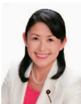
福田はるみ 副議長