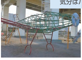
飛行機に乗って気分はパイロット