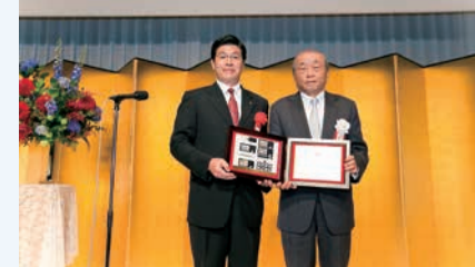
第6回中日新聞社広告大賞表彰式に出席しました