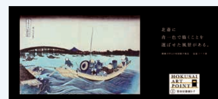
HOKUSAI ART POINTの一部