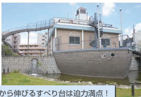
船から伸びるすべり台は迫力満点！