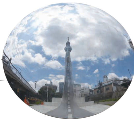
リフレクトスケープ 業平橋付近にある「Reflectscape」。丸い大きな凸面鏡で、東京スカイツリー®と記念撮影ができます。