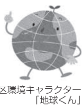
墨田区環境キャラクター「地球くん」