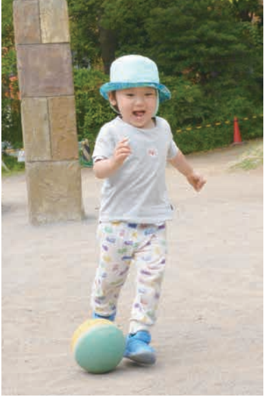
わんぱく天国は遊びの宝庫！