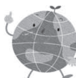
墨田区環境キャラクター「地球くん」