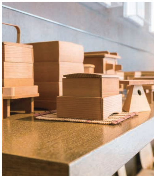
折箱博物館「木具輪」