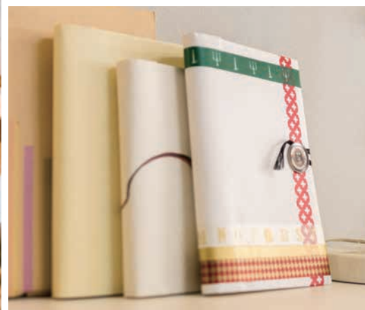
名刺と紙製品の博物館「SAKURA TERRACE」

各催しの内容等の詳細は、各問合せ先に問い合わせるか、区ホームページをご覧ください。