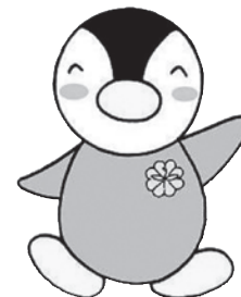
東京都民生委員・児童委員キャラクター「ミンジー」