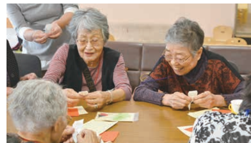
つながりを育む「ふれあいサロン」

く、委員同士の連携を深めることができました。このような幅広いつながりは、かけがえのない財産です。今後も、こうしたつながりを大切に、地域みなさんに“寄り添える存在”をめざして、日々活動していきたいです。