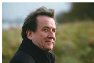
ルドルフ・ブッフビンダー