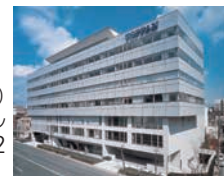
凸版印刷(株) 本所GCビル(本所1-32-5)

てきました。そんな私達は印刷技術を核に文化財の後世への継承にも力を入れており、「すみだ北斎美術館」共同創設者として、今後も地域への貢献と文化の発信に努めてまいります。