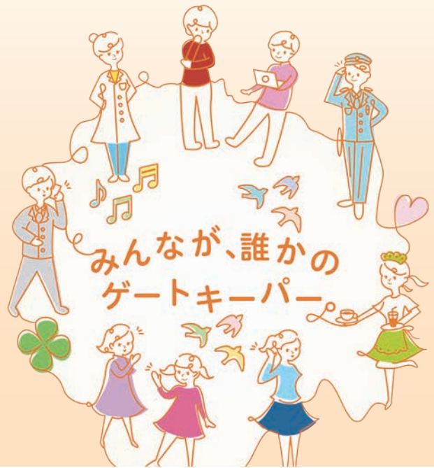
ゲートキーパーとは、身近な方の自殺のサインに気づき、受け止め、適切な相談窓口へつなぐなどの役割が期待される人のことです。