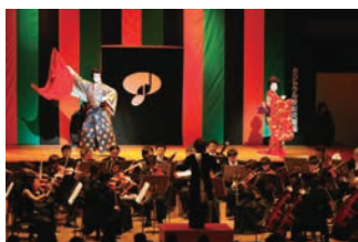
オペラを文楽様式で演出