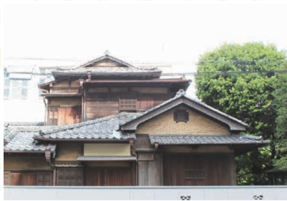
【上】昭和28年竣工の照田家住宅外観