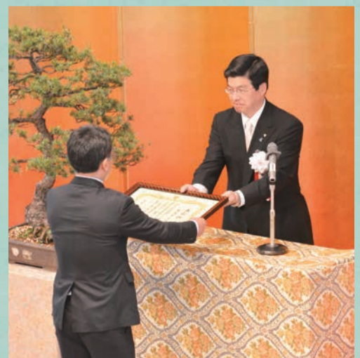
すみだの地域力向上の大きな原動力となった区功労者の方々に、表彰状をお贈りしました

さて、今年も雨のシーズンがやってきます。日本人には、雨の風情を楽しむ繊細な感性が備わっています。降り方の違いを感じ取ったり、花との調和を愛でたりするなど、この時期ならではの雨の味わい方を探してみたいでしょうか。