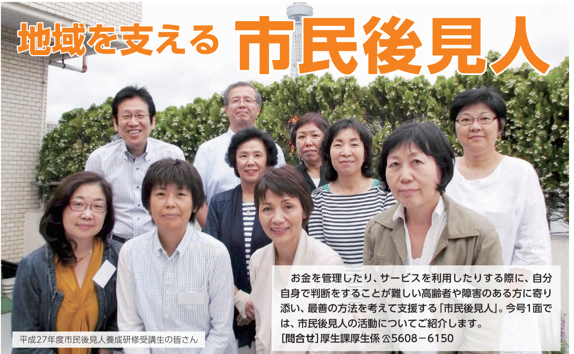
平成27年度市民後見人養成研修受講生の皆さん

お金を管理したり、サービスを利用したりする際に、自分自身で判断をすることが難しい高齢者や障害のある方に寄り添い、最善の方法を考えて支援する「市民後見人」。今号1面では、市民後見人の活動についてご紹介します。 [問合せ] 厚生課厚生係 ☎5608-6150