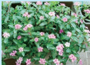
「人権の花」を育てよう!! (区立小学校の児童が育てた「日々草」)