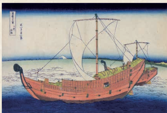
「富嶽三十六景 上総ノ海路」(大判錦絵)

「すみだ 北斎美術館」(平成28年11月22日開館)に収蔵する「富嶽三十六景」シリーズの作品をご紹介します。