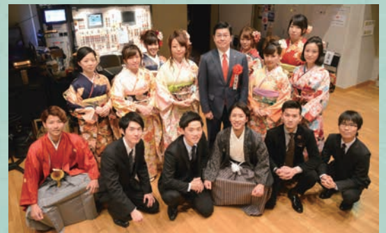
感動の式を作り上げた「成人を祝うつどい実行委員会」の皆さん