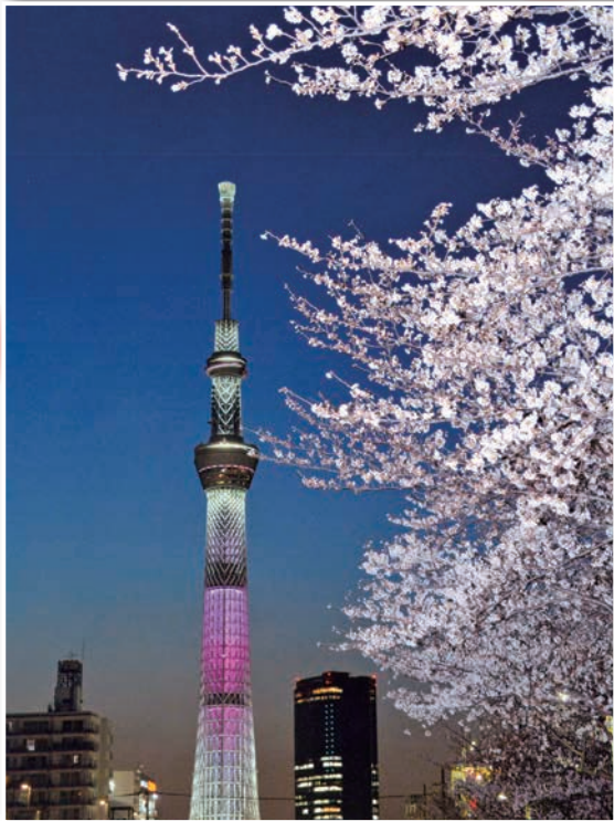
「タワーと桜」