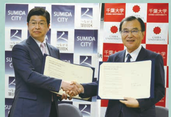
千葉大学との包括的連携協定に調印しました

誕生によって文化の香り高いまちづくり、そしてそれを担う人づくりを一層推進し、「すみだの夢」の実現に向けた歩みを着実に前進させていきます。