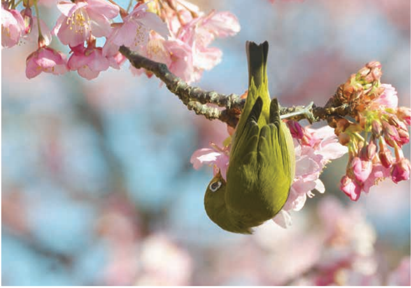
「おっとと」

すみだには、どんな“春の知らせ”が届いたのでしょうか。ここでは、応募があった写真の中から数点をご紹介します。