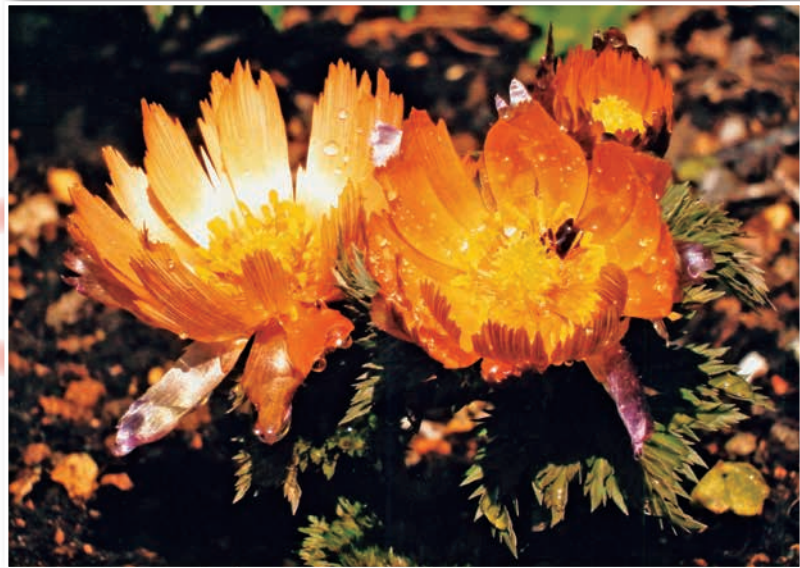
「春を告げる福寿草」