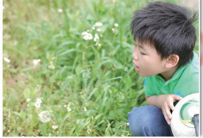
「ちいさい春、みつけたー！」