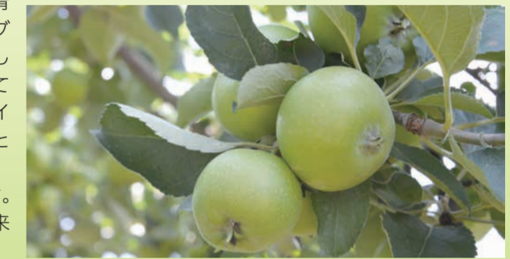
ブルムリーアップル 8月下旬～9月上旬

小布施では、あらゆる果物がとてもおいしく作れます。墨田区の皆さん、ぜひ小布施の絶品果物を味わいに来てください。