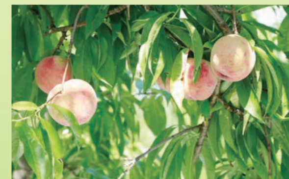
あかつき 8月上旬～中旬