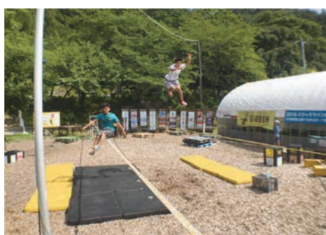
浄光寺スラックラインパーク

最近耳にするようになった「スラックライン」。幅わずか5センチの弾力のあるライン上で様々な技を披露し、難易度や美しさを競うスポーツです。小布施町では3年半前に、町内の浄光寺境内にスラックラインの施設が設置されてから、「町民のスポーツ」として広く親しまれています。9月17日(日)・18日(祝)には、アジアで初となるスラックラインワールドカップが開催されることになりました。全国大会の開催からわずか3年でワールドカップ開催をつかみ取った小布施の人々の熱い想いに触れてみてください。