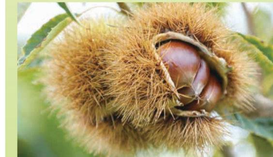
墨田区の皆さんには、栗はもちろんです。小布施の人々の温かさにもふれてもらいたいですね。 栗 9月中旬～10月下旬