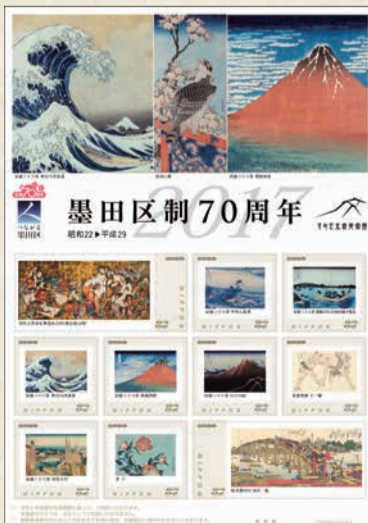
オリジナル フレーム切手「墨田区制70周年」 *画像はイメージ

【価格】1500円【販売場所】すみだ北斎美術館(亀沢2-7-2)、産業観光プラザ すみだ まち処(押上1-1-2東京ソラマチ ® 5階)、吾妻橋観光案内所(区役所2階)、両国観光案内所(JR両国駅[-両国-江戸NOREN]1階)ほか